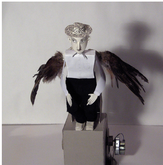
«Bevingad». Papirautomata av Vanna Bowles